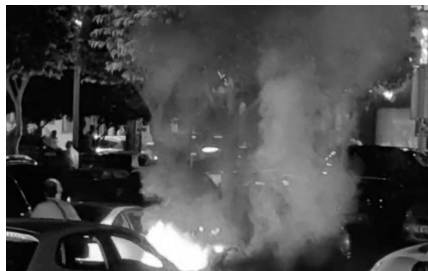
Αριστερά: Σπασμένο κουρείο μετανάστη στο κέντρο Λεμεσού Δεξιά: Φωτιά σε αυτοκίνητο σε κεντρικό χώρο στάθμευσης στη Λεμεσό